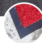
Borda Unik - 2,5cm